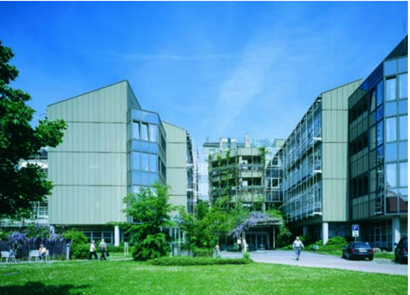
Abbildung: Die Klinik Eichstätt in der Frontansicht

Der Begriff Qualität hat in den letzten Jahren im Gesundheitswesen, insbesondere im Krankenhaussektor, an großer Bedeutung gewonnen. Für die Klinik Eichstätt bildet der Begriff „Qualität“ die Grundlage jeglichen Handelns. Mit dem vorliegenden Qualitätsbericht will die Klinik Eichstätt im Sinne des Gesetzgebers gemäß § 137 SGB V zu mehr Transparenz im Leistungsgeschehen beitragen. Der vorliegende Bericht soll über Art und Anzahl der Krankenhausleistungen und über aktuelle Maßnahmen der Qualitätssicherung berichten. Dieser Bericht soll nicht nur die Partner der Klinik, wie z. B. die niedergelassenen Ärzte, die Krankenkassen und die weiteren Sozialleistungsträger informieren, sondern auch den Patienten und der Bevölkerung einen Überblick über das Leistungsspektrum und das Volumen hoch qualifizierter Klinikleistungen geben.